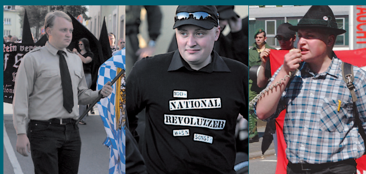
Derselbe Neonazi aus München auf thematisch unterschiedlich ausgerichteten rechtsextremistischen Demonstrationen

Hier können Sie kostenlos Broschüren anfordern, die Ihnen weiteren Aufschluss über Symbole und Codes der extremen Rechten geben und anhand derer Sie die Wölfe im Schafspelz unter Umständen enttarnen können.